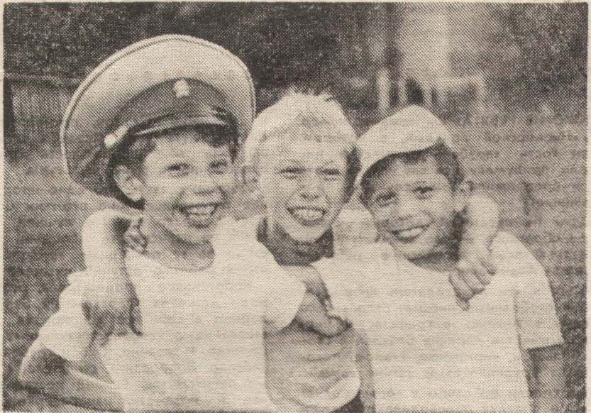
«ЗАКАДЫЧНЫЕ ДРУЗЬЯ».