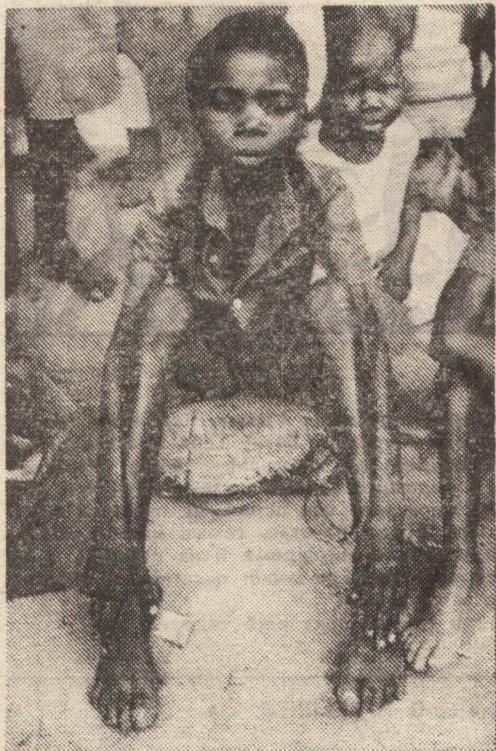
Не каждый день ест досыта этот мозамбикский мальчишка из города Джиле. Ежедневно в Африке умирают 137 из каждой тысячи детей. Большинство из них от постоянного недоедания.